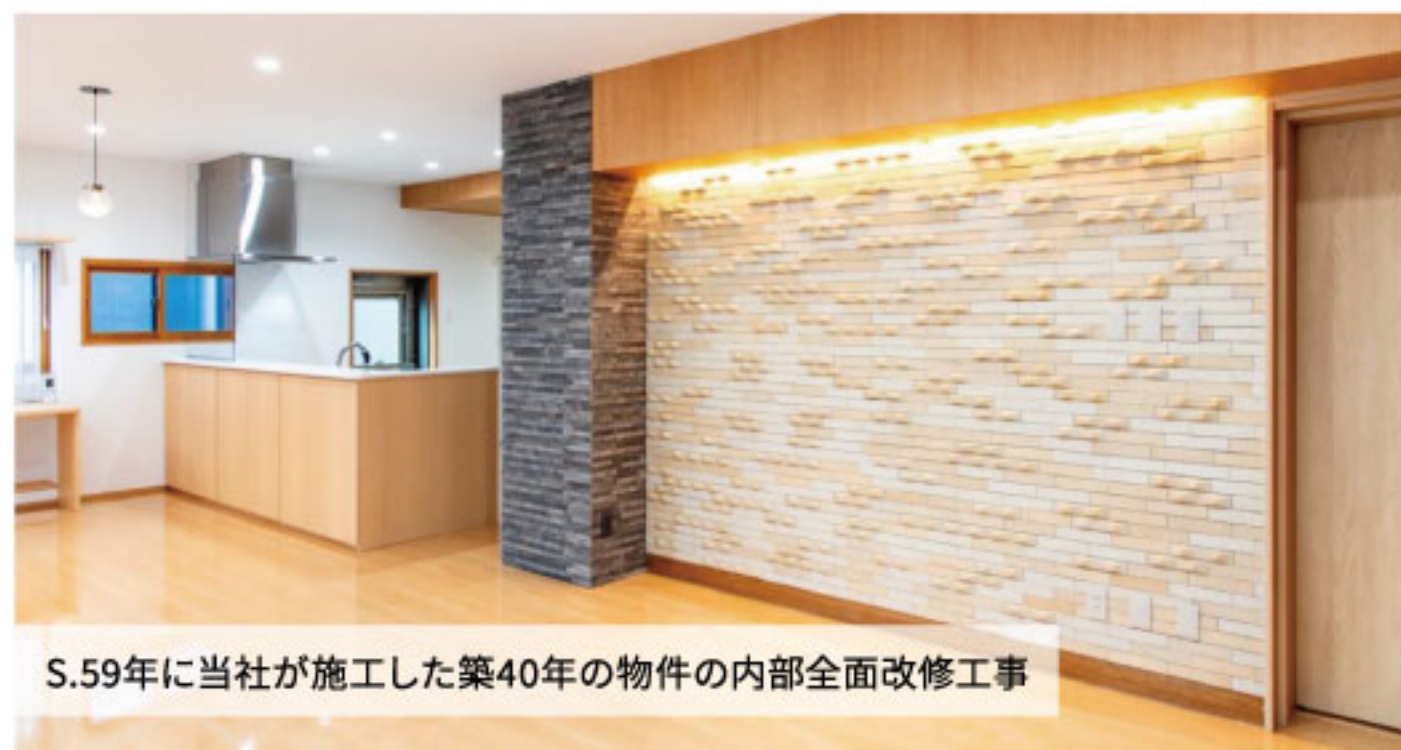
S.59年に当社が施工した築40年の物件の内部全面改修工事